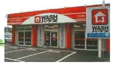
● コインランドリー