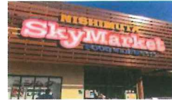
● スカイマーケット