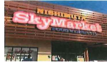
●スカイマーケット