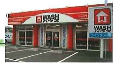
●コインランドリー